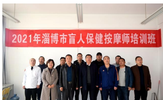
图3-5 淄博市第十届盲人按摩社会培训班开班

由淄博市残疾人联合会主办、淄博市特殊教育中心承办的第十届市盲人按摩社会培训班于10月19日在学校正式开班，本期培训是学校承担的第23期培训任务，为期30天，共招收12名学员。由学校中医康复保健教师执教，向盲人学员系统传授职业道德、人体解剖、经络腧穴等基本理论知识和伤科、妇科、儿科等专科实践操作手法，还涉及就业创业指导课程，学员培训完成并通过考核后，将颁发结业证书。