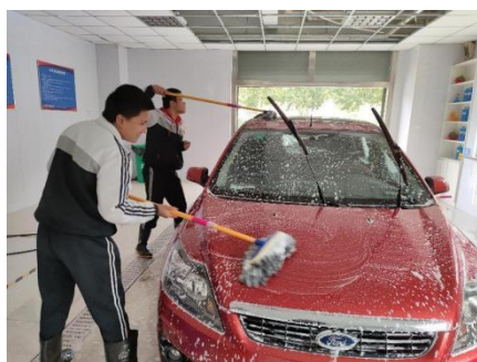
图 2-3 智障学生汽车美容专业