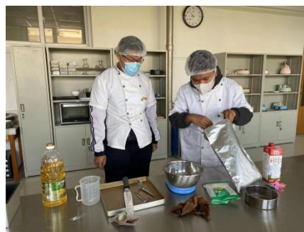
图 2-4 智障学生烘焙专业

3.积极研制专业建设标准。 坚持上层对接国家中职专业设置标准、专业教学标准，落实到学校层面的专业建设方案，研究并积极探索出符合特殊学校实际校情的专业人才培养方案编制标准、专业核心课程建设标准、“双师型”教师团队认定标准、专业教学条件建设标准和专业质量评价标准。在已有市规划课题《特教学校盲聋学生职业技术校本课程