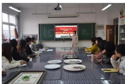
图 2-12 职教党史学习教育成果展示

3. 师德锤炼。 持之以恒抓好师德师风建设，学校制定《师德师风与法治专题教育学习方案》《教职工师德师风建设学生问卷调查表》，制定教职工师德考核方案，组织教职工师德考核工作，积极开展教师宣誓、师德自检等活动，组织了 2 次青年教师师德教育报告会。提升“立德树人”在产教深度融合过程中的引领作用，学校将职业课程与师德师风建设相融合，在课程教学中渗入思政、工匠精神、社会主义核心价值观思想，培养出一支具有高尚师德高专业技能的教师队伍。