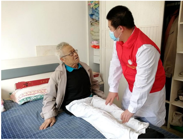
图3-2 学生志愿者为社区老人进行按摩服务

为进一步弘扬雷锋精神，践行社会主义核心价值观，在学雷锋纪念日到来之际，淄博市特殊教育中心联合“双报到”单位宝山社区开展“传承红色基因，争做时代新人”志愿活动。师生志愿者们和社区工作人员先后来到天勤苑、花山府第小区，走进前辈家中，仔细的询问他们的家庭情况，并为他们带来温暖。师生志愿者在与老人们聊天的同时，为老人们打扫房间，整理衣物，志愿者的辛勤付出，换来了老人们脸上幸福的笑容，小小的屋子里欢声笑语，其乐融融。学生志愿者们还利用自己在学校所学专业专长，为老人们讲解推拿技能与肩颈保健等知识，并为老人们提供中医按摩服务，让他们舒展筋骨，温经通络。通过本次志愿服务活动，不仅弘扬了雷锋精神，同时也进一步增强了党员服务群众的责任心，拉近了党群关系，营造了尊老、爱老、敬老、助老的和谐氛围。