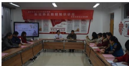
图 2-6 医教结合补充中医保健专业教材

2.及时更新和补充教材内容。 随着产教融合、校企合作展开，学校派遣专业教师深入企业生产一线，及时了解行业发展现状和趋势，并根据发展变化不断地调整和改进教学内容和教学计划，及时更新教学资料和教学案例，促使校本教材能够及时融入企业新工艺、新规范、新要求。