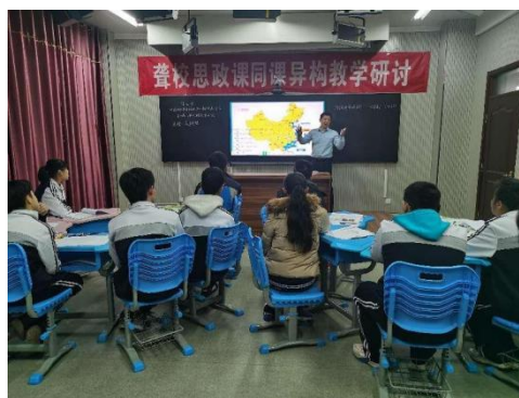
图 4-4 思政课教学比赛

2.学生管理更加规范。 根据特殊教育招生对象的新变化，做好日常招生统计摸底工作，按时确定和公布年度招生简章，通过相关渠道进行广泛宣传；规范做好学籍管理和资助工作。资助工作接受了建校以来最高层次的检查-国家级审计，学校资助工作执行标准准确、认定工作规范、资金发放及时、档案材料齐全，顺利通过了审计；组织了冬季“冬阳送暖活动”，四名学生接受了资助，报送的听障部资助案例，获得省