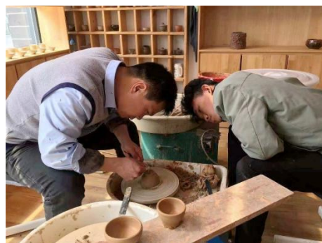
图2-14 岗位实习部署会