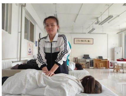
图 2-1 视障学生按摩保健专业

式，提供校内实习机会，另一方面积极开拓淄博本地推拿市场，减少外出实习受阻问题。鉴于培智学生存在理解力较弱、语言沟通能力薄弱、精细动作不强等情况，学校采取分类分层的个别化培养方案，对重度残疾的学生采取居家就业，对轻中度学生采取支持性就业培训指导，推荐这部分学生到本地超市、工厂等企业就业。