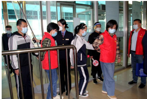
图3-4 爱心助盲志愿服务团队演示导盲技能

走进淄博站，为车站工作人员开展导盲技能培训，满足残障人士乘车需求，优化车站的助残服务质量。培训的过程中，爱心助盲志愿服务队员介绍了盲人心理特点和科学的助盲导盲技能，并与车站工作人员进行了现场互动。随后，志愿者在车站主要场景演示导盲技能，模拟引导盲人进站、安检、乘坐电梯、检票、上下站台、购票等各个环节，让车站工作人员对视障人士乘车的照顾更科学、更贴心。经过此次培训，淄博站工作人员纷纷表示受益匪浅，将会在今后的工作中让盲人朋友获得更方便更舒适的候乘车体验。本次导盲技能培训是市特教中心学雷锋月系列活动的一项内容，学校将围绕新时代文明实践开展形式多样的志愿服务活动，为残障人士融入社会生活提供便利，助力和谐社会建设。