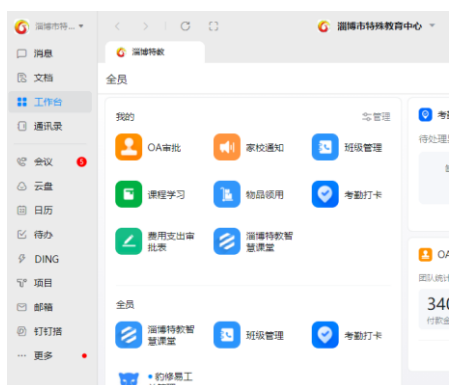
图 4-3 钉钉管理系统

1.治理体系更加健全。 完成公章使用、智能公务用车、车辆租赁业务、山东通、钉钉办公平台两端一运维使用管理。强化组织人事管理。实行全员聘用制，按要求进行岗位分级设置核定。严格执行公开招聘政策，落实年度考核方案。严格考勤制度和干部人事档案管理制度，按时组织教职工参加继续教育和“互联网+教师专业发展”培训。严格执行岗位绩效工资制度和工资福利制度。按照教代会通过的评聘办法组织职称推荐评审工作。机构管理、人员编制管理和法人登记管理工作制度化、规范化。强化财务资产管理和审计管理。学校严格执行财务管理制度，遵守财经纪律。一年一次向教代会报告工作。