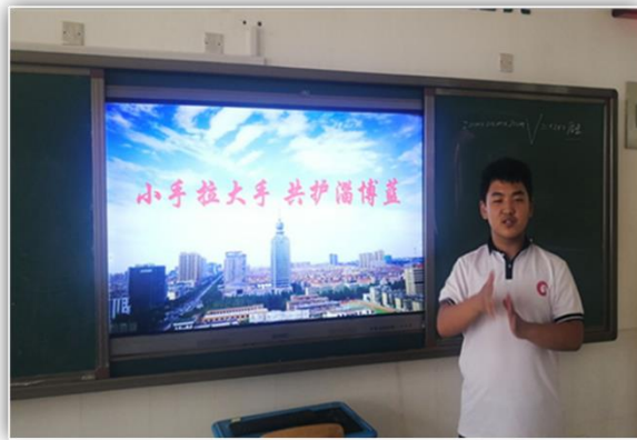
图13 “小手拉大手 共护淄博蓝”手语宣传活动

2.校园生态进一步优化。 学校一直坚持 24 小时值班制度，全天候守护特殊儿童；安全教育入脑入心，安全演练追求实效。学校荣获全省平安校园标杆学校。强化生态环保教育，“小手拉大手，共护淄博蓝”“垃圾分类进校园”，校园更生态、更文明。