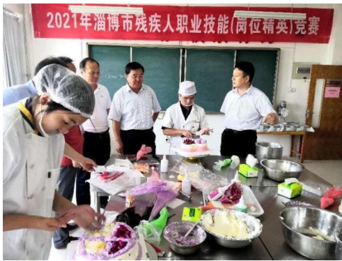
图 4-7 淄博市残疾人职业技能大赛

6.疫情防控更加严格。 修改完善了学校疫情防控方案、预案等两案九制。成立核酸检测工作专班，加强日常防控，严格出入管理，对教师、学生和外来人员车辆物品等采取了严格管理措施，确保了学校疫情防控工作安全有序。