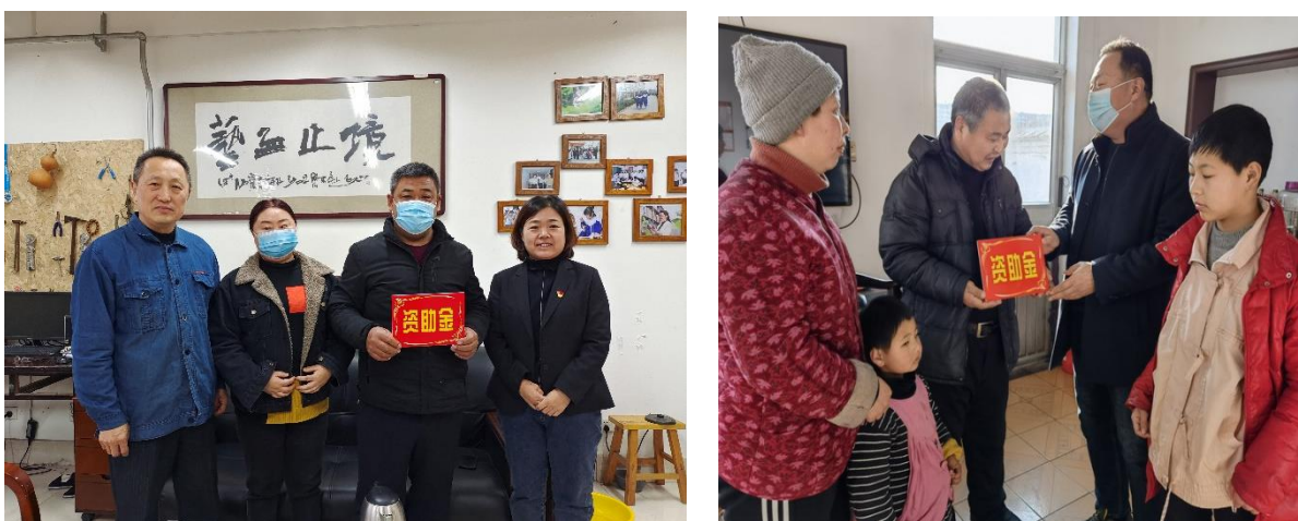
图 1-4 心手相牵 冬日送暖活动

为帮助家庭经济困难学生解决冬季春节期间生活难题，学校制定寒假走访工作安排，开展“心手相牵，冬阳送暖”活动。在走访中，学校走访领导老师向受访家庭详细讲解各学段教育扶贫资助政策，通报学生在校期间享受资助的项目及金额，鼓励家长支持子女接受更高层次教育。最后，亲手将新春送温暖慰问金送到家长手中。