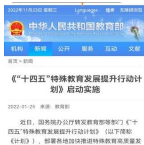
图4-1 “十四五”特殊教育发展提升行动计划

2021 年，在市委市政府的关心支持下，在市教育局的正确领导下，学校坚持党建引领，以事业单位绩效考核和文明校园创建为总抓手，以“十四五”特殊教育提升计划颁布实施、全市教育品质提升行动启动为契机，以培养全面适应社会的学生为目标，实施四大工程，落实八大教学项目，努力创建适合每个学生需要的品牌名校。学校再次被评为市级考核优秀单位，顺利通过省级文明校园复核。