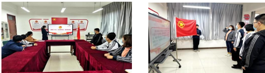
图1-2 开展学生入团仪式教育

学校深化团员青年理想信念和思想道德建设，紧紧围绕迎接党的二十大召开组织开展“砥砺奋进守初心 青春献礼二十大”主题团日系列活动。组织“入团第一课”，带领新团员了解了中国共青团的历史进程，学习了团徽、团旗等共青团知识，了解了习近平总书记对青少年和共青团的殷切希望；以“阅读点亮智慧，书香润泽校园”为主题，向团员们发出读书倡议，学生进行读书推荐，并分享读书心得。