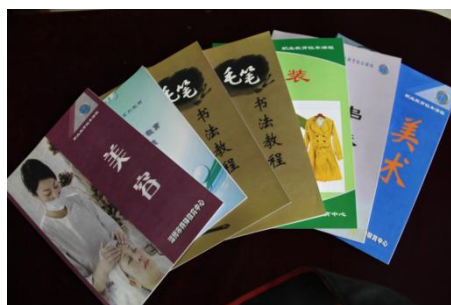
图 2-5 校本教材

1.开发符合特殊学校职业教育规律的校本教材。 除去公共基础课程沿用国家通用教材，其他专业则努力开发符合特殊学校教育规律的校本教材。语文、数学、物理等公共基础课选用人教版普通学校教材，中医康复保健专业则使用全国盲人职业中专统编教材；其他专业根据市场需求、学生特点及教学需要开发了一整套校本教材，在教学中使用、完善。随着市规划课题《特教学校盲聋学生职业技术校本课程开发研究》顺利结题，成果不断深化推广，目前学校已经开发听障、视障中专的专业课程教材。在十四五期间，学校编制了部分培智中专校本教材，形成以烘焙、家政、汽车美容为核心课程的教材体系。