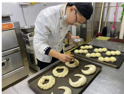
图2-16 跟岗实习做面包