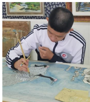
图 2-2 听障学生工艺美术专业