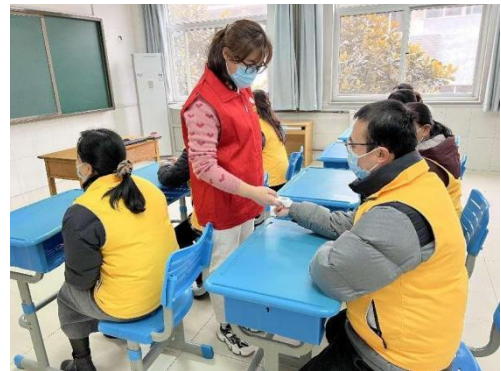
图 4-8 疫情防控演练