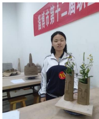
图1-5 学生参加淄博市第十二届职业（技工）院校技能大赛