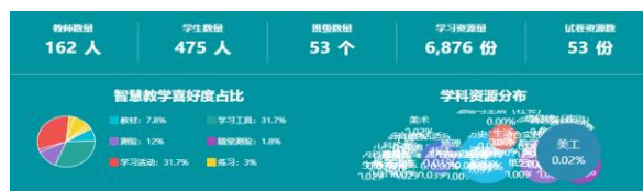
图2-8 教师自制教学资源数据