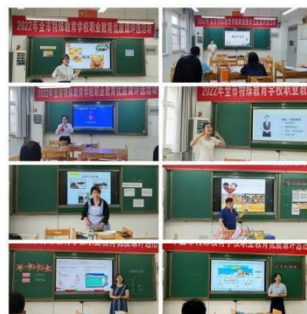
图 2-13 全市特殊教育学校职业教育优质课评选